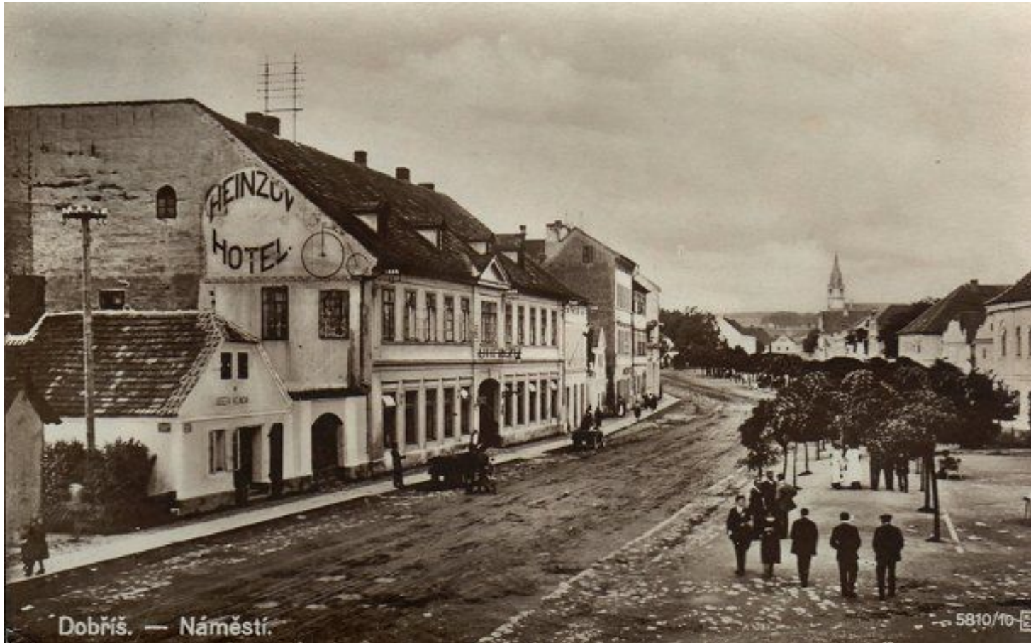
Dobříš 100 years ago