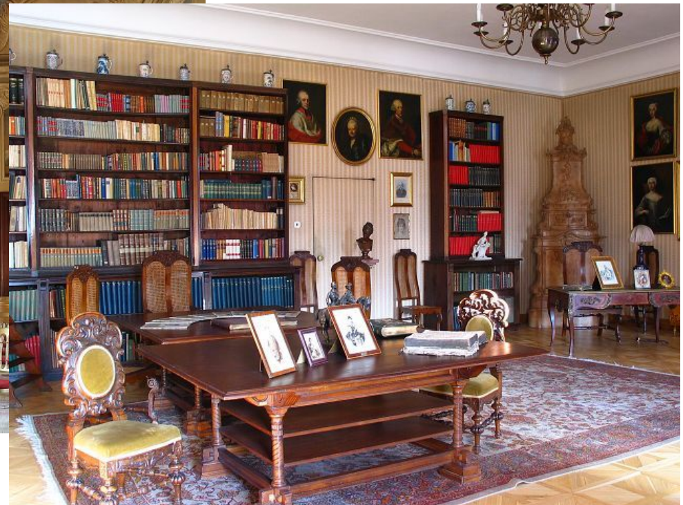
Interiors of Dobris chateau