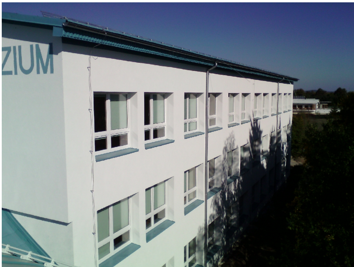
Školní budova v listopadu 2014 (nahore) a září 2015 (dole)